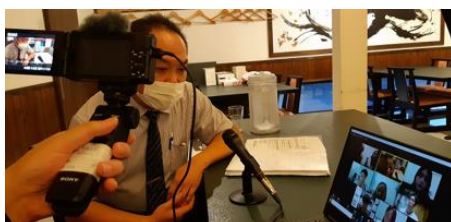
茨城の現地スポットの取材の例