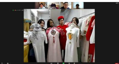
現地スポットのオンライン取材の例